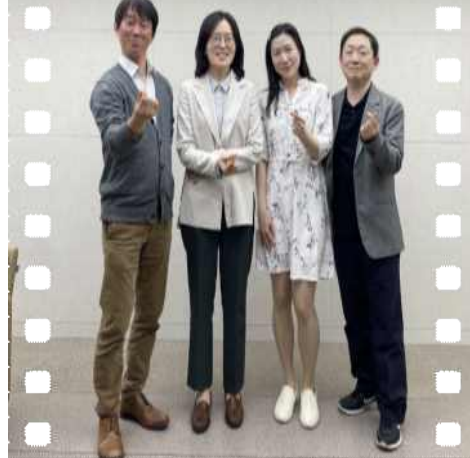
Life Care Mentoring